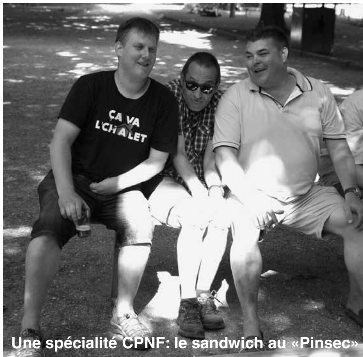
Une spécialité CPNF: le sandwich au «Pinsec»