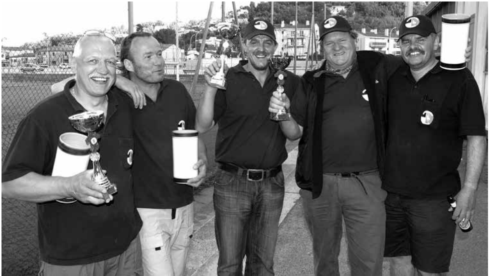
2005 - Sortie du club à Vallauris (France) avec visite de la fabrique de boules Obut et tournoi avec le club local