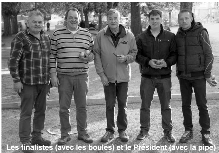
Les finalistes (avec les boules) et le Président (avec la pipe)