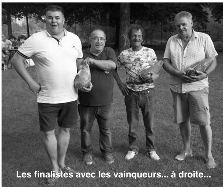
Les finalistes avec les vainqueurs... à droite...